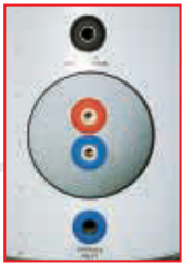
ET típus hőcserélőjének külső csatlakozásai