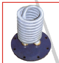
Ónozott, bordázott, réz hőcserélő, külső hőforrás hasznosítására.

Nagyon gazdaságos üzemeltetést tesz lehetővé a végfelhasználónak.